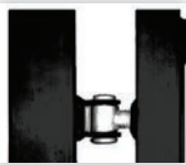
Scharnier 90° opendraaiend