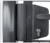
Sluiting d.m.v. een Locinox slot