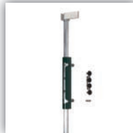
t.b.v. dubbele poort